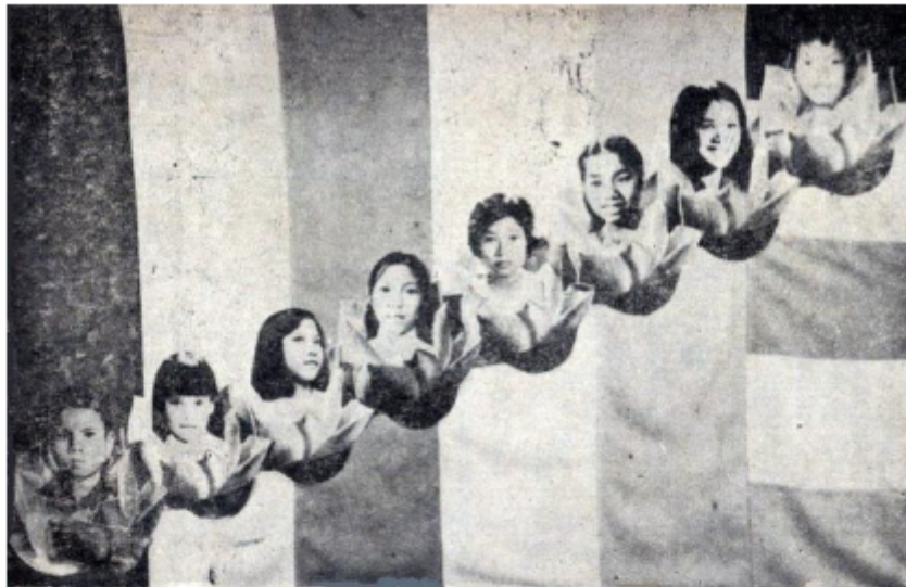
Hình ảnh tám em Oanh Vũ GĐPTVN được nhắc đến trong Thông Tư.

Sáu mươi năm, một vòng Hoa giáp đã trôi qua; đó cũng là đánh dấu một chu kỳ vận hội thăng trầm của lịch sử. Sau mùa pháp nạn, GHPGVNTN được thành lập, tập hợp tất cả các hệ phái, tông phái Nam truyền Bắc truyền, cùng hòa hợp dưới bóng đức Thích Tôn và Giáo Pháp thiện thuyết để công hiến ước nguyện hòa bình Dân Tộc, cùng phát huy truyền